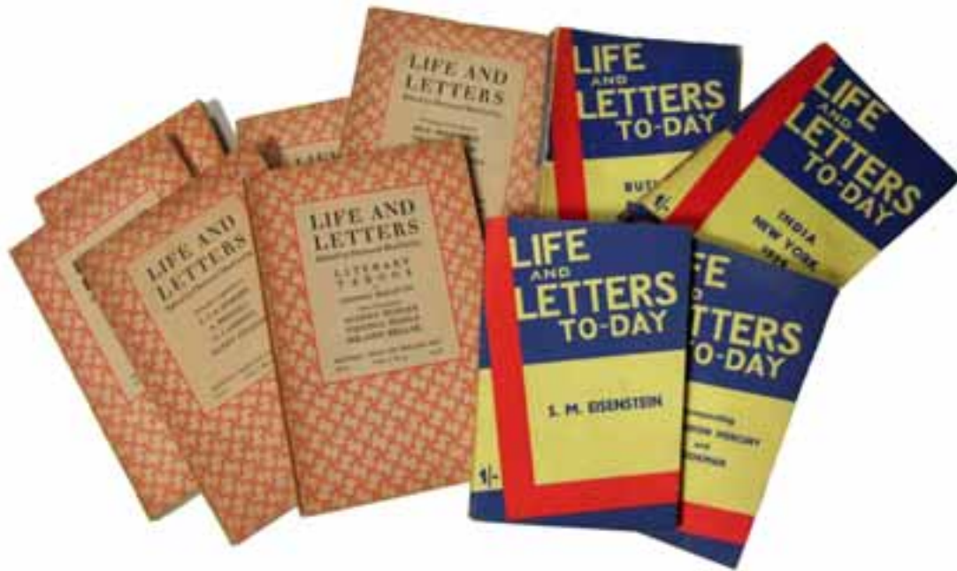
Vols. 1-65 (all publ.), London, 1928-1950. Original wraps. Fine set in original imprint.

An international monthly of living literature.